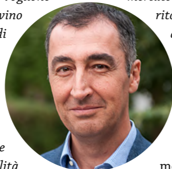
Nella foto, Cem Özdemir

Questa istanza segue una domanda sempre più consistente di vini analcolici da parte dei consumatori. "Sempre più persone vogliono godersi il vino senza alcol di tanto in tanto e questa non è certo una cattiva notizia. Se si vuole bere vino analcolico, si dovrebbe poterlo fare anche in qualità di produzione biologica" ha detto in un comunicato il ministro dell'Alimentazione e dell'Agricoltura tedesco Cem Özdemir . Tuttavia, ad oggi non è ancora consentita la pratica della de-alcolizzazione nei regolamenti sul biologico. "Dovremmo cambiare questa situazione in fretta. Per questo mi sto battendo a Bruxelles e con i colleghi degli Stati membri per un adeguamento contemporaneo e mirato del regolamento. Questo passo apre le porte a un ulteriore mercato in crescita, nel pieno spirito della viticoltura tedesca e la rafforza in modo sostenibile".