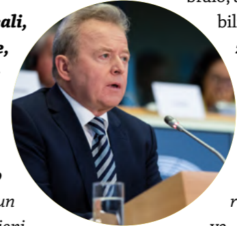
Nella foto, il Commissario UE Wojciechowski

"La produzione di cereali, semi oleosi, vino, carne, latte, zucchero, frutta e olio d'oliva" ha tenuto a precisare Wojciechowski "rimarrà al livello attuale (variazioni di più o meno dell'1%) e si prevede un leggero calo delle importazioni agricole, compreso tra 1 e 4 per cento". Secondo il politico polacco, l'Unione europea "manterrà un sufficiente e significativo surplus di esportazioni nella produzione di cereali, latte e carne". In particolare, la produzione di carne diminuirà solo dello 0,4%, mentre l'autosufficienza rimarrà al 105% (carne bovina) e al 120% (carne suina e pollame).