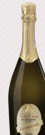
Cartizze '22 LE COLTURE