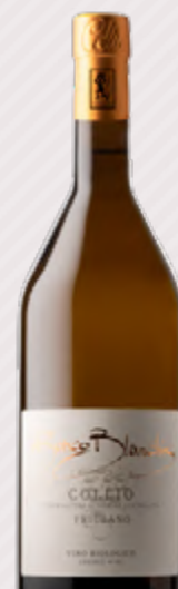
Collio Friulano '22 RONCO BLANCHIS