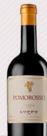
Nizza Pomorosso '19 COPPO