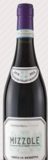
Valpolicella Superiore Sup. Mizzole Cecilia Beretta '18 PASQUA